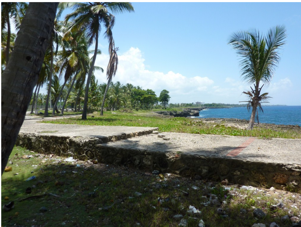
En de natuur op het eiland is schitterend ...